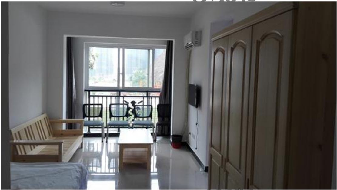
▲ 培训公寓内部配置标准