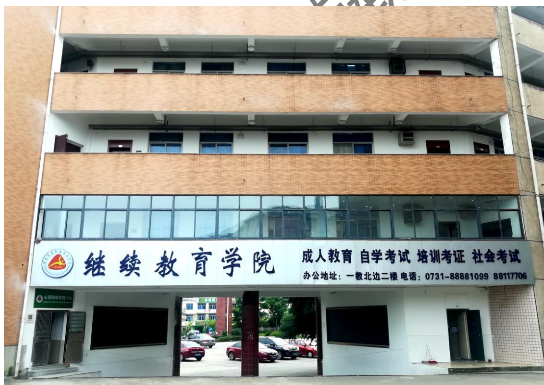
▲ 继续教育学院独立办公区域

学校基本办学条件指标达到 A 类标准，建有湖南省优秀双创示范基地的湘商创业园、中央财政支持建设的现代商务综合实训中心大楼、湖南省优秀社科科普基地湘商文化院、湖南高职院校首个思政实践教学中心等文化场所。以云计算为核心的商务智慧云初具规模，校园网主干网络达万兆传输，以大数据、智能感知和物联网为特征的智慧校园建设正稳步推进，泛在式教学和实训得到普遍应用，实现了教育教学资源全面数字化。继续教育学院拥有独立办公场所和区域、培训公寓、培训教室，可以满足办公和培训需要。