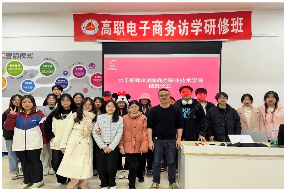
图 12 结业典礼部分优秀学员合影留念