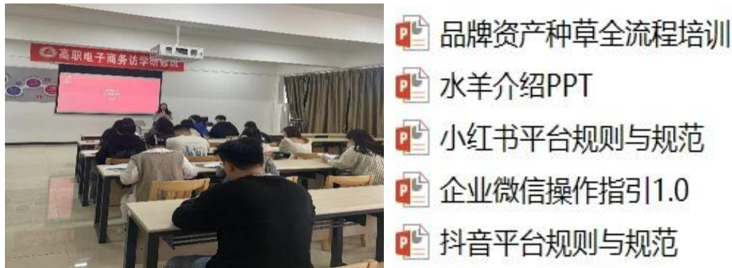
图6 培训现场及三天体系化培训课件

的开展实践，并在实践中收获成长，坚定个人职业规划。新媒安排了专业的培训讲师团队，在实训基地为各位同学进行了为期3天的培训课程。包括企业文化、品牌介绍、业务介绍、拓展技巧等在内的全方位的知识体系。