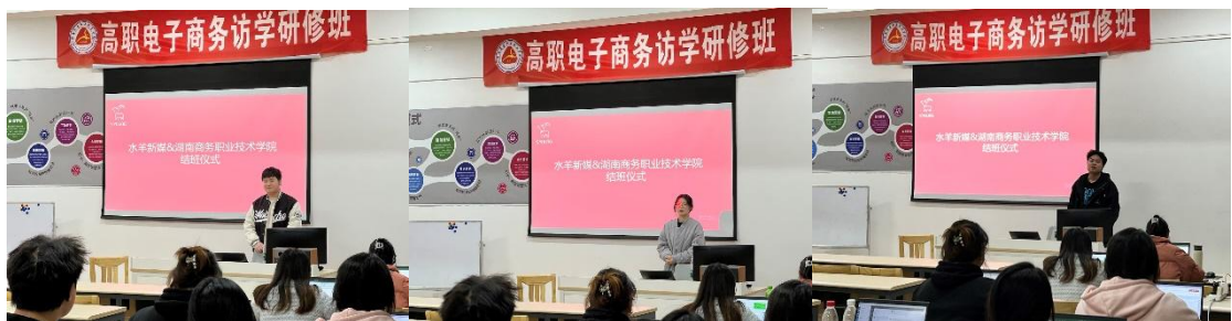
图 11 结业典礼优秀学员分享