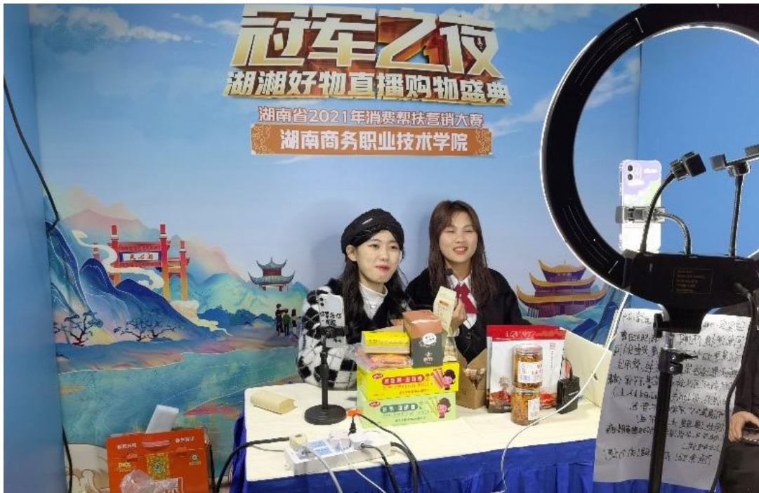
图3 湖南商务职业技术学院移动商务专业学生参加营销大赛现场