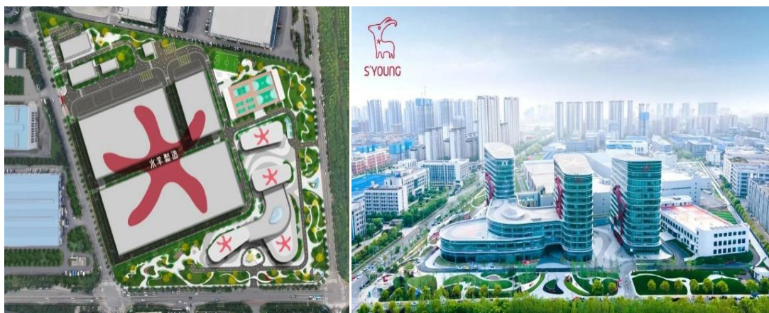
图 1 湖南水羊智能制造产业园

合作业务，同时与各大平台头部 KOL 保持稳定良好合作。其中品牌资产种草部门，致力于通过创新的内容营销策略，帮助品牌在各大社交平台上实现有效的用户触达和品牌种草。公司通过与 KOC/素人合作，运用独特的 AM+正编帮带模式，快速筛选并培养实习生，以满足移动商务专业学生的实训需求。