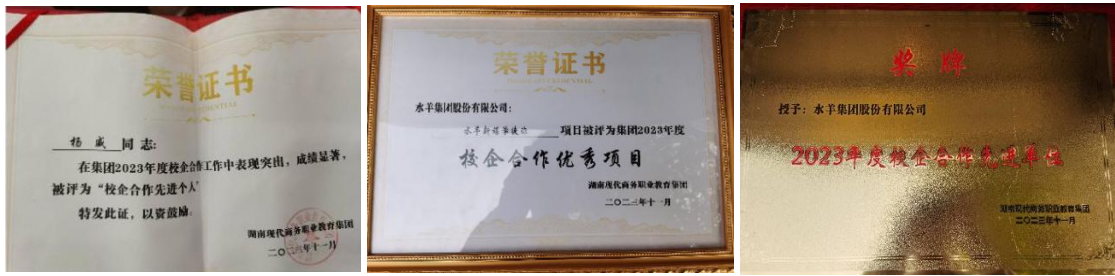
图 15 水羊新媒学徒班相互获得 2023 校企优秀项目等荣誉

在整个合作期间，水羊新媒&湖南商务职业技术学院学徒班项目取得了显著成果，在 83 家企业中获得了多项殊荣，包括 2023 校企优秀项目奖、2023 年度校企合作先进单位奖等。负责人雾隐也获得了校企合作先进个人奖，同时水羊新媒成为湖南现代商务职业教育集团理事单位。