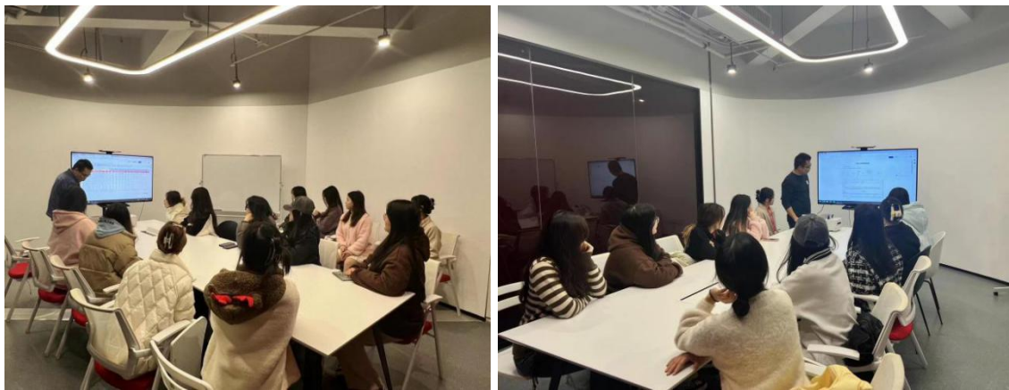
图 14 来到公司实习的学生进行更系统的培训和持续指导

驻校实习结业后, 有 16 位同学选择来到水羊公司继续实习, 为此品牌资产种草部带来了新鲜血液的同时, 也让同学们更加直观地感受走出校园后的实践, 真实的职场氛围。