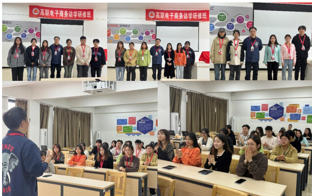
图 4 水羊新媒总经理为入职水羊新媒的同学授予并佩戴工牌