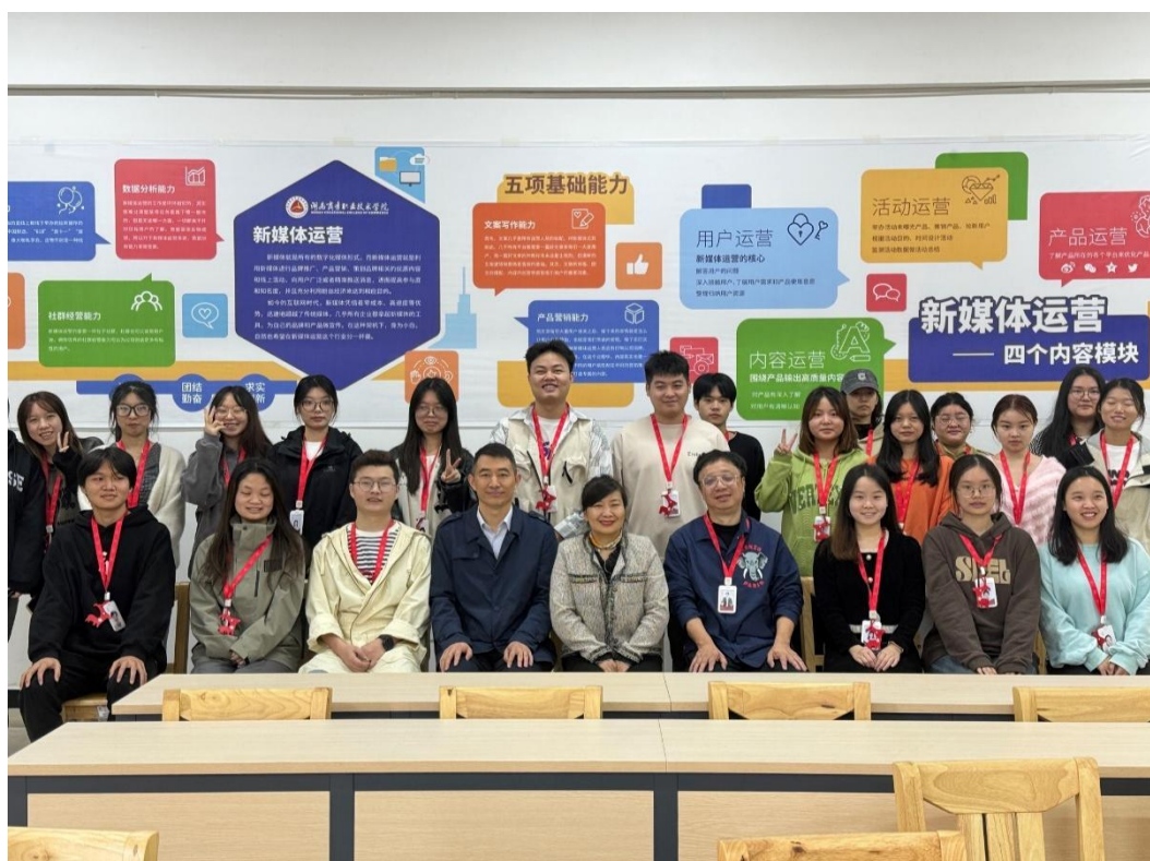
图 5 水羊新媒与湖南商务职业技术学院共创合作班全员合影