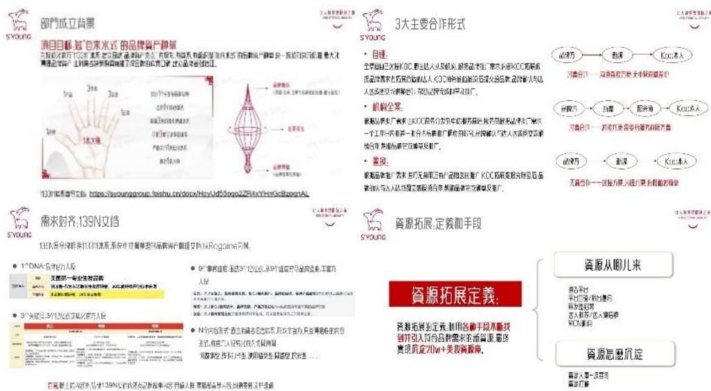
图7 课程部分详细内容

实操实践环节包括由导师带领复盘拓展数据结果分析、群内沟通问题以及学们每日的总结心得，以确保大家能够及时的讲所遇问题暴露和解决，将课本上的理论知识转化为实际操作能力。